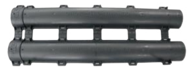
Außen- und Innenansicht des click-fix