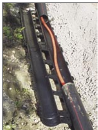
click-fix über bestehendes Rohr legen