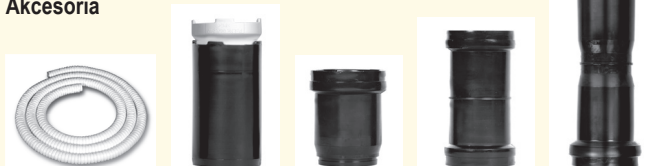
Towar na metry Końcówka szczytowa Złączka nakładana Nakładana nasuwka Podwójna złączka

Do optymalnego połączenia łuków rurowych euro-x oferujemy pasujące końcówki szczytowe i złączki. Zwinęty w rolki towar sprzedawany na metry do właściwego przedłużenia łuków rurowych otrzymują Państwo przy wymiarach \varnothing 50 do \varnothing 110 przy specjalnych długościach do 50m. Przy wymiarach \varnothing 125 i \varnothing 160 dostarcza się towar na metry w rolkach do 25 m.